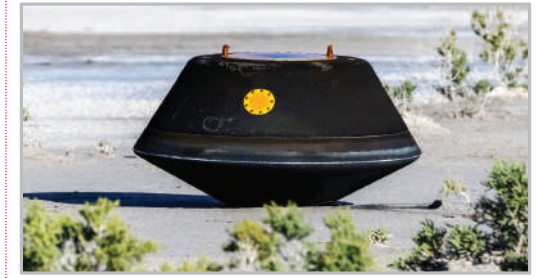
فرود کپسول ناسا از فضا در بیابانی در ایالت یوتا - آمریکا