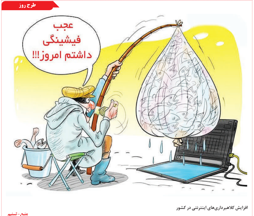
افزایش کلاهبرداری‌های اینترنتی در کشور منبع - تسنیم

دولت فنلاند به عنوان اولین تجربه خود در زمینه اعتبارنامه سفر دیجیتال (DTC)، یک پاسپورت دیجیتال برای مسافران راه‌اندازی کرده که می‌تواند از طریق گوشی هوشمند حمل شود. مجله Time Out اعلام کرد که در حال حاضر یکی از نوآوری‌های امیدوارکننده در زمینه گردشگری و سفر، چیزی است که دولت فنلاند به عنوان اولین تجربه خود در زمینه اعتبارنامه سفر دیجیتال (DTC)، که اساساً یک پاسپورت دیجیتال برای مسافران محسوب می‌شود راه‌اندازی کرده، که می‌تواند از طریق گوشی هوشمند حمل شود. اجرای آزمایشی این نوآوری جدید در حال حاضر در شهر هلسنکی فنلاند به همکاری پلیس این کشور Finnair و شرکت Finavia که فرودگاه هلسنکی را