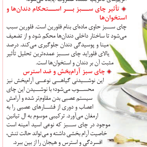
تأثیرگذارتر از ویتامین سی و

همچنین اشخاص مبتلا به سرطان‌هایی نظیر سرطان خون، ریه، معده، سینه و روده که چای سبز می‌نوشند در درمان بیماری خود کمک قابل توجهی دریافت می‌کنند زیرا میزان آنتی‌اکسیدان‌های موجود در آن ۱۰۰ برابر تأثیرگذارتر از ویتامین سی و