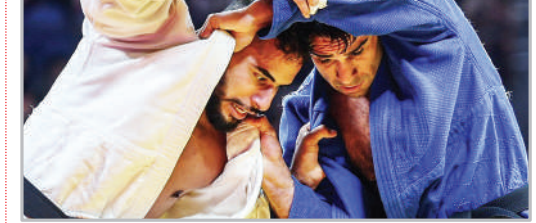
بازی‌های آسیایی هانگ‌و - مسابقات جودو