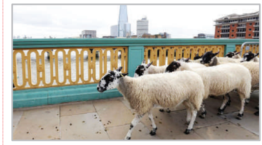
عبور گله‌های گوسفند از روی پل - لندن