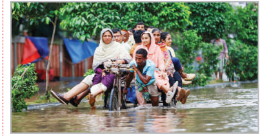
سیل - شهر داکا بنگلادش