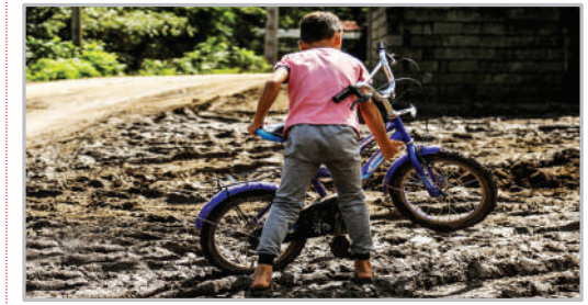
خسارات سیل در استارا